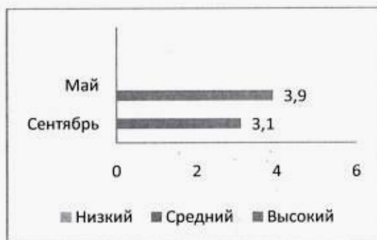
Диаграмма № 3 образовательная область «Речевое развитие»