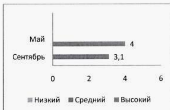
Диаграмма № 5 образовательная область «Социально-коммуникативное развитие»