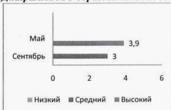
Диаграмма № 4 образовательная область «Познавательное развитие»